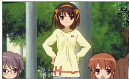
プロモーション カード

本商品の販売に際し、作品ごと販売カードと同様のデザインの“プロモーションカード”を制作いたしました。こちらは非売品として無料の配布を予定しています。