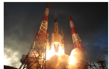
H-IIA ロケット/「みちびき4号機」