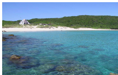
“日本の水浴場88選 浦田海水浴場”